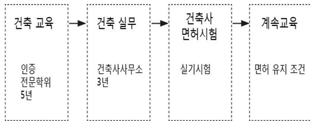
그림 1. 한국 건축사 자격 취득 과정

건축 분야는 건축사법에 따라 전문지식의 활용과 다양한 보상을 통해 독자적 배타성을 보장받고 있다. 건축 분야의 건축사의 자격은 미국과 한국에서 동일하는데 의사와 같은 면허제가 아닌 자격등록제이다. 이는 건축설계나 계획은 누구나 할 수 있지만, 자격은 건축 허가 등 행정 절차에서 나타남을 의미한다. 즉 건축사는 행정업무의 법적 효력을 갖는 자격이다. 현재 한국 건축사의 자격과정은 5년 학부/2년 석사 인증 전문학위와 최소 3년 건축 실무 후 자격시험에 합격하여야 시험 응시 자격이 주어진다(그림 1).